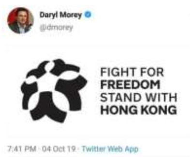
Gambar 1. Cuitan Morey

Permasalahan yang terjadi antara NBA dengan partner di Tiongkok ini dipicu oleh adanya cuitan yang dibuat oleh seorang General Manager dari tim Houston Rockets yakni Daryl Morey pada tanggal 4 Oktober 2019 yang berisikan dukungannya terhadap gerakan pro-demokrasi di Hongkong (Smith, 2019). Cuitan tersebut dapat dilihat pada gambar berikut: