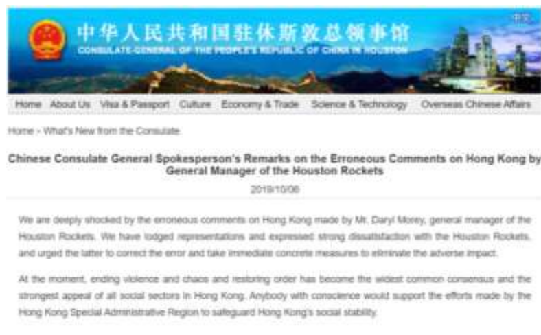
Gambar 3. Pernyataan Pemerintah Tiongkok Melalui Website Konsulat Jendral nya di Houston

Setelah peristiwa itu, pada 6 Oktober 2019, beberapa pihak di Tiongkok pun memberikan respon terkait cuitan Morey. Mulai dari pemerintah Tiongkok, melalui kantor konsulatnya yang berada di Houston mengeluarkan pernyataan ketidakpuasan terhadap cuitan Morey, dan menyatakan bahwa pernyataan Morey merupakan sebuah kekeliruan (Xiang, 2019). Pernyataan tersebut diunggah dalam situs resmi konsulat jenderal pemerintah Tiongkok di Houston yang dapat dilihat pada gambar berikut.