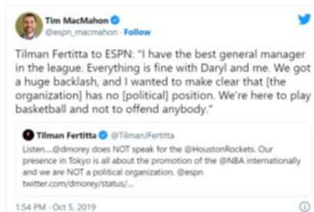
Gambar 2. Cuitan Reporter ESPN yang Berisi Pernyataan dari Pemilik Tim Houston Rockets

Cuitan tersebut pun mendapat respon dari berbagai pihak. Pemilik dari tim Houston Rockets memberikan respon terkait cuitan Morey yang menyatakan bahwa pernyataan Morey yang mendukung gerakan pro-demokrasi Hongkong tersebut merupakan pernyataan pribadi Morey, dan tidak merepresentasikan tim Houston Rockets sendiri (DuBose, 2019). Pemilik Houston Rockets yang bernama Tilman Fertitta menyatakan hal tersebut melalui sebuah cuitan dan juga melalui wawancara dengan reporter ESPN, yang kemudian pernyataan tersebut dipublikasi melalui sebuah cuitan yang dapat dilihat pada gambar berikut: